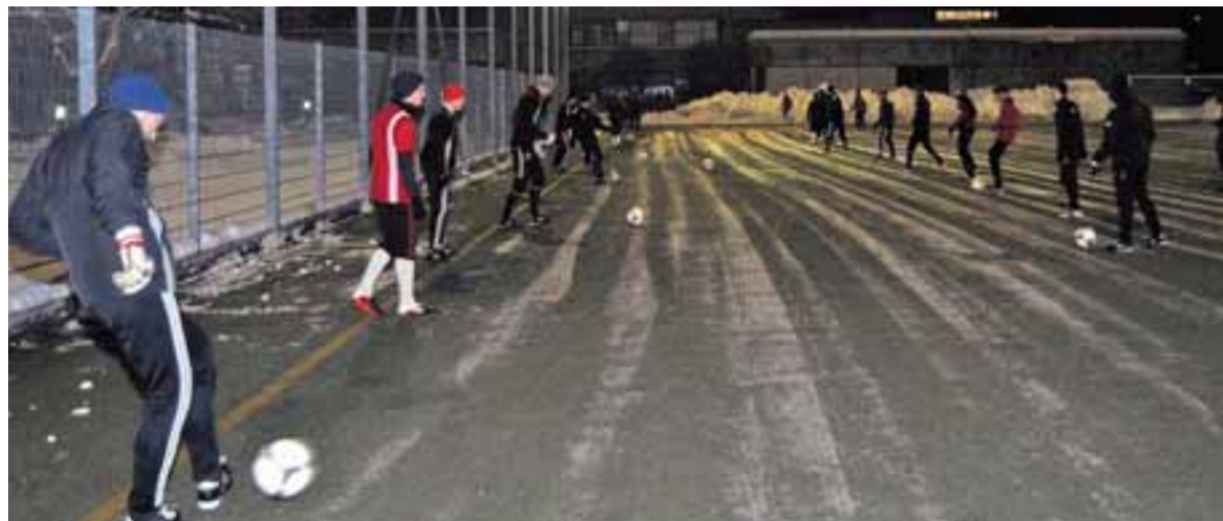
Fleißige Helfer hatten den Rainer Kunstrasenplatz vom Schnee befreit, sodass die Regionalliga-Kicker bei Minusgraden erstmals wieder im Freien den Ball hin und her schieben konnten.