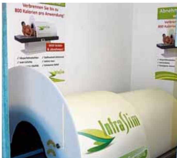
InfraSlim ist eine Infrarot-Saunaliege, die beim Abnehmen hilft und gut für die Gesundheit ist.

Das Rollenstudio Ritter ist eine gute Adresse bei Figurproblemen